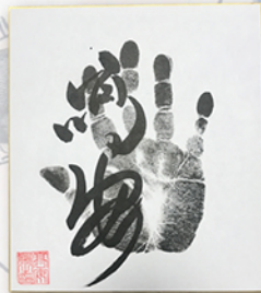
●力士直筆サイン例